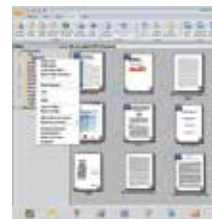
The PaperPort SE14 main screen

- A escolha profissional para organizar seus documentos.